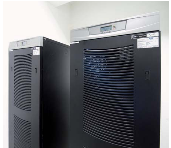
2 Eaton 9355 USVs mit 20kVA

EPS Electric Power Systems, Maria Anzbach