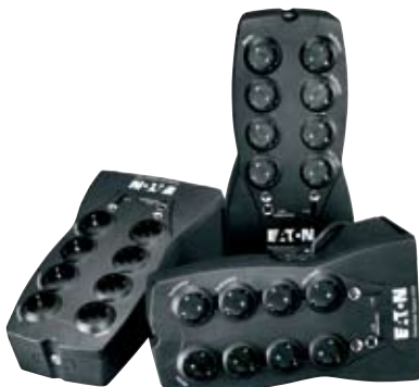
Joustava sijoitus mihin tahansa