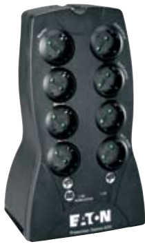
Eaton Protection Station 800 VA